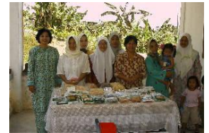
女性伝統菓子生産グループ (マレーシア)