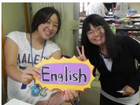
英語合宿（英語プレゼン強化）

国際社会や国内の地域で貧困削減、ジェンダー、コミュニティ強化に 貢献できる人材育成、現場から問題提起できる人材育成