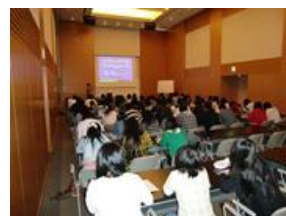
JICA 関西訪問（スーパーグローバル基礎知識講座）